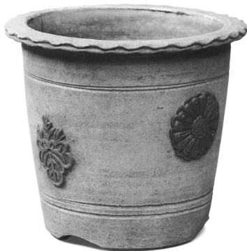
図3 焼締菊桐紋植木鉢 (京都・宝鏡寺)

今回清華家の徳大寺家屋敷における出土が確認されたことで、清華家にも同様に禁裏御用関連品が下賜された事例を重要と考え今回報告した。