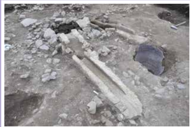
漆喰の導水施設（江戸時代後半）