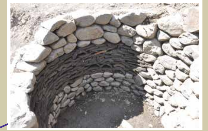
石と瓦積み井戸（江戸時代後半）