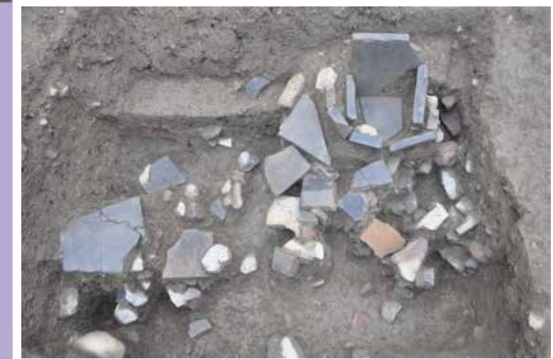
箱状塙組と塙敷 （室町時代）