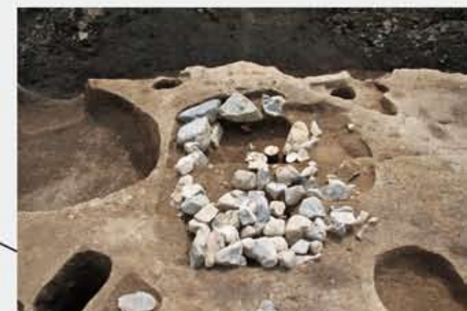
石組の墓 (16世紀・戦国～安土桃山時代)