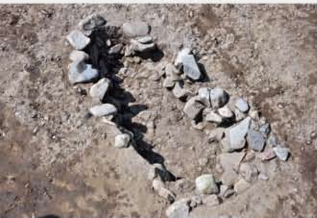
石組の墓 (16世紀・戦国～安土桃山時代)