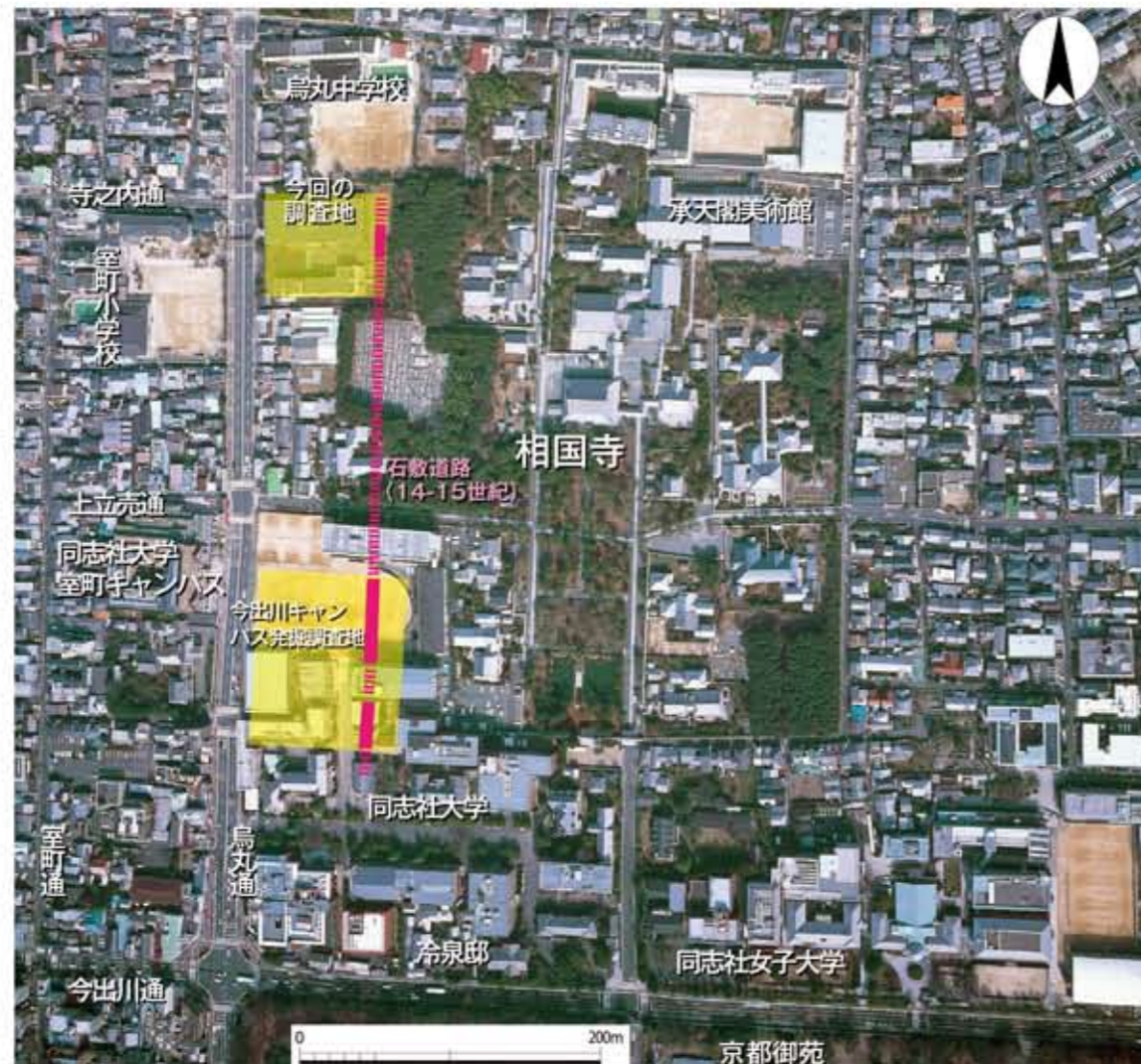
今回の調査地と周辺の調査地（1：5,000）

【江戸時代（17～18世紀）】 江戸時代前半の遺構は少なく、この地域が空地になったと考えられます。この時代の遺構には堀350・井戸500があります。井戸500からは、初期の伊万里産大皿や黄瀬戸椀・丹波産すり鉢などが出土しました。江戸時代後半になると多くの遺構が検出され、土器や瓦などが多量に出土することから、この場所はふたたび塔頭として使われていたようです。また、調査区南西部には、烏丸通り沿いの町屋のごみ捨て穴と思われる遺構から多数の土器や瓦片がみつかりました。