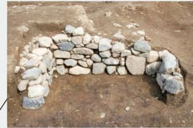
石組の地下蔵 (16世紀・戦国～安土桃山時代)