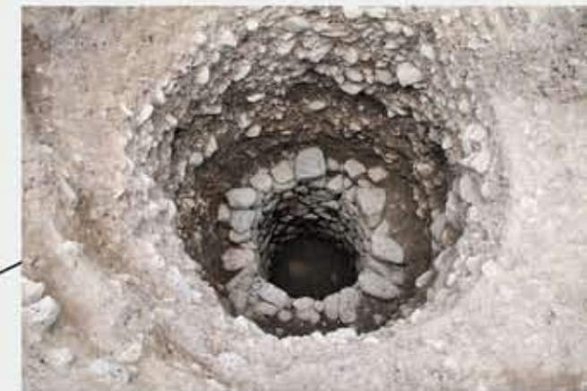
井戸500 (17世紀・江戸時代前半)