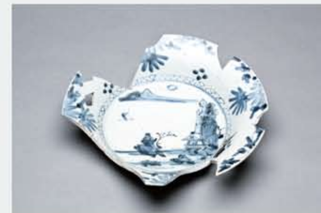
井戸500から出土した伊万里産大皿 (17世紀・江戸時代前半)