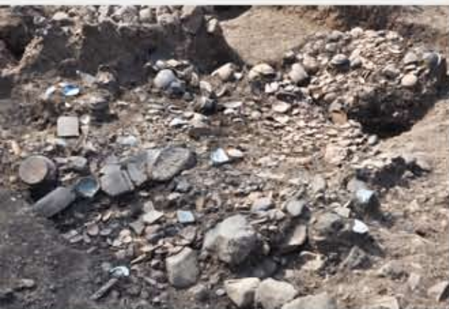
町屋のごみ捨て穴 (18世紀・江戸時代後半)