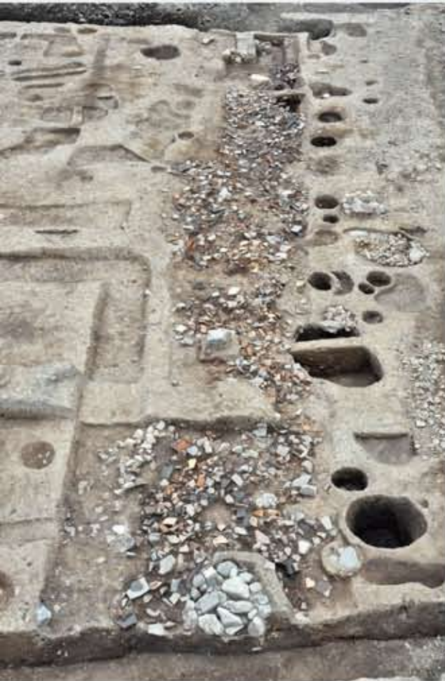
焼瓦・焼土で埋まった溝1300 (15世紀・室町時代後半)